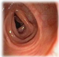
Normaal uitzicht van dikke darmslijmvlies

Clostridium difficile is een bacterie die voorkomt in de darm, ook zonder dat u er klachten door heeft. Bij verzwakte weerstand en verstoring van de darmflora, vaak door innemen van bepaalde antibiotica, zal deze bacterie de overhand krijgen en gifstoffen aanmaken die de darmwand aantasten.